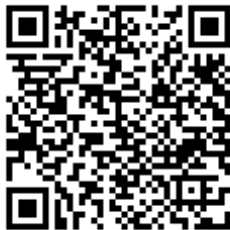
Código QR para validación en sede

Regulación CSV: Decreto 3628/2017 de 20-12-2017